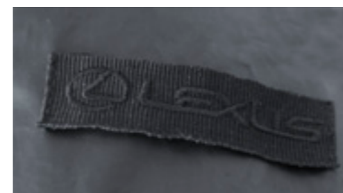
Webband mit eingestickten Lexus Logo